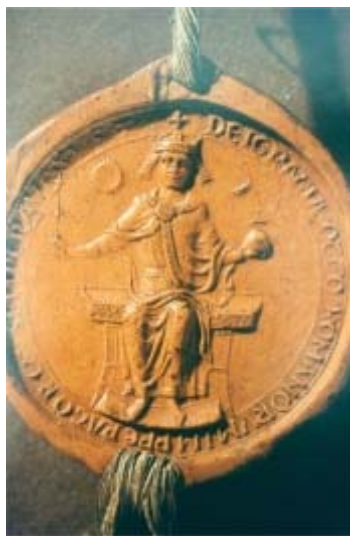
Zegel van Maria van Brabant, ex-keizerin en bewoonster van het Oude Huys.

Maar voordat dit “nieuwe” kasteel er was, stond niet ver van de plek waar het kasteel nu staat een veel oudere burcht, het “Oude Huys”. Niet zo lang geleden zijn – na de sloop van een oude fabriek aan de Zuid-Willemsvaart – van deze oude burcht restanten opgegraven. De vondsten hebben laten zien dat hier een groot en imposant complex heeft gestaan, waar rijke en voorname mensen, zelfs een ex-keizerin, moeten hebben geleefd.